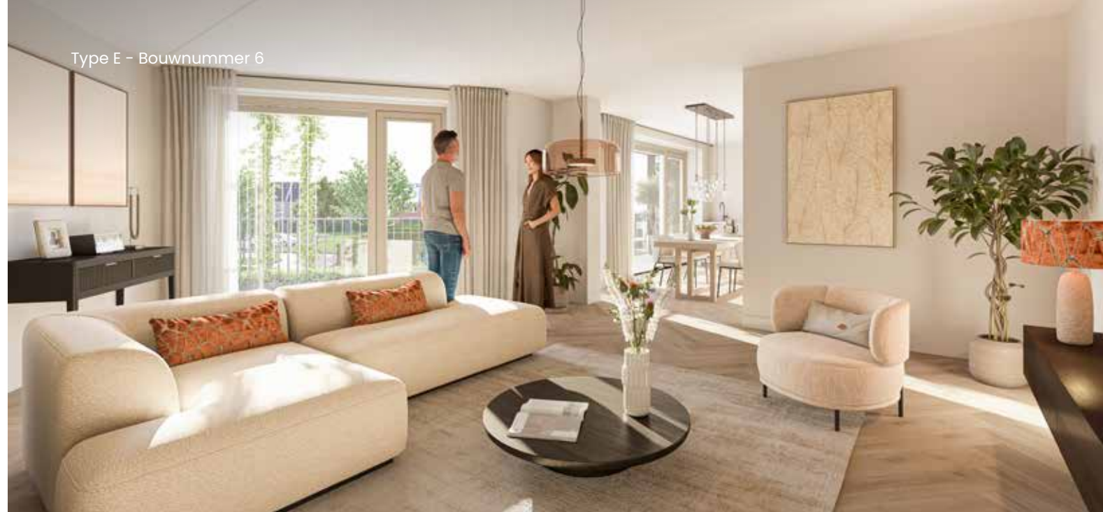
Type E – Bouwnummer 6